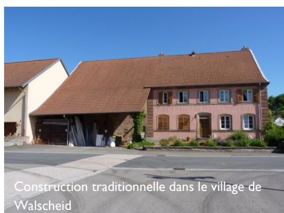
Construction traditionnelle dans le village de Walscheid