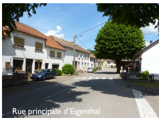
Rue principale d'Eigenthal