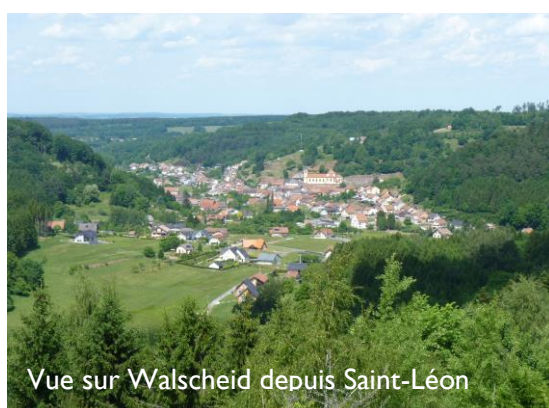
Vue sur Walscheid depuis Saint-Léon