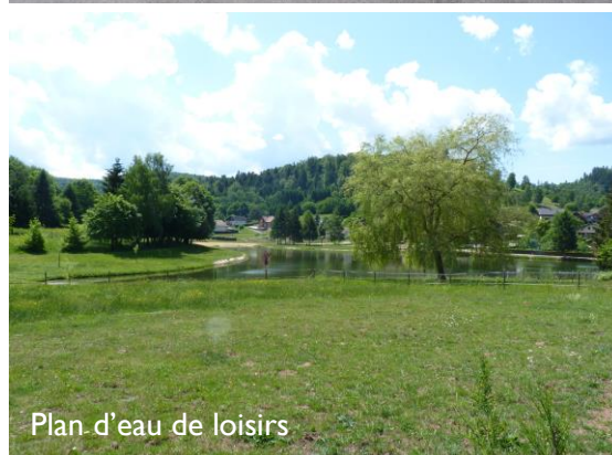
Plan d'eau de loisirs